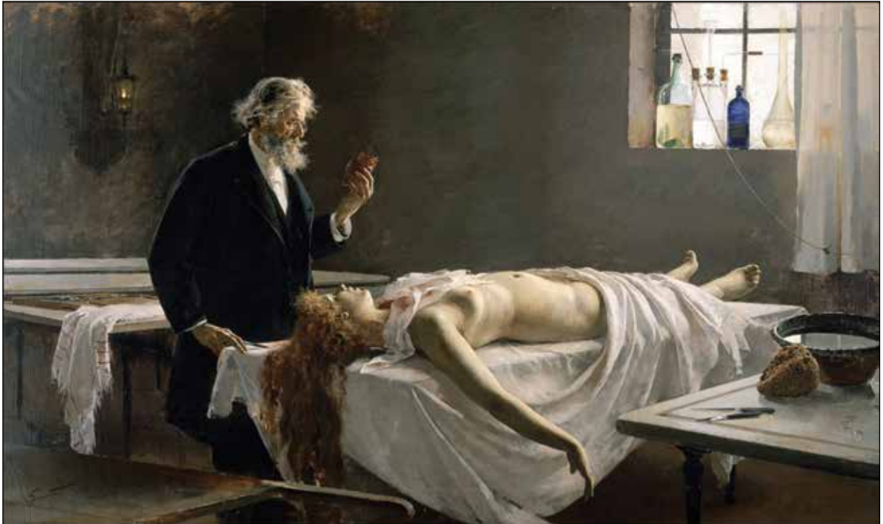
La autopsia , Enrique Simonet (1890).

te, tratamiento de emergencia, expedientes médicos y definición de muerte. El amplio rango de temas cubiertos en cursos de Medicina Legal demuestra que esta materia abarca consejos o tips para prevenir mala práctica. Mientras que virtualmente ningún plan de estudios de Medicina Legal está completo sin la mención de este tema. La creciente influencia de los movimientos del consumidor afecta todos los segmentos de la economía incluyendo la atención médica. Los pacientes quieren más información sobre su condición y la manera recomendada de tratamiento. La atención a menores, con o sin consentimiento de los padres, es un problema legal actual. Definición de muerte y la destitución de sistemas de asistencia, ponen en discusión cuestiones médicas y legales 1 .